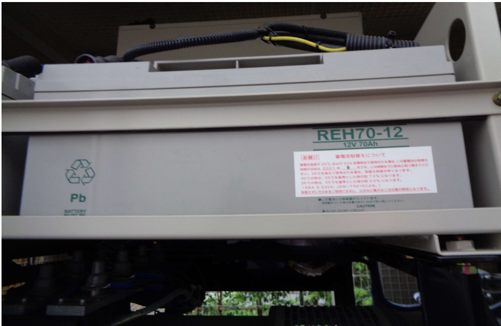
No. 2 非常用発電機 バッテリー 交換時期近し