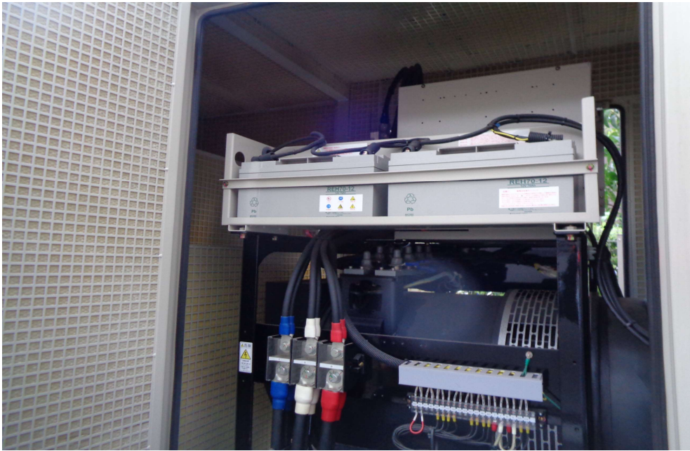
No. 1 非常用発電機 バッテリー 交換時期近し