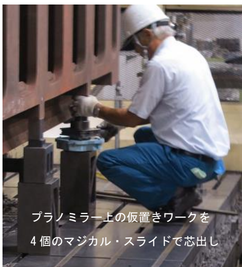
プラノミラー上の仮置きワークを 4個のマジカル・スライドで芯出し