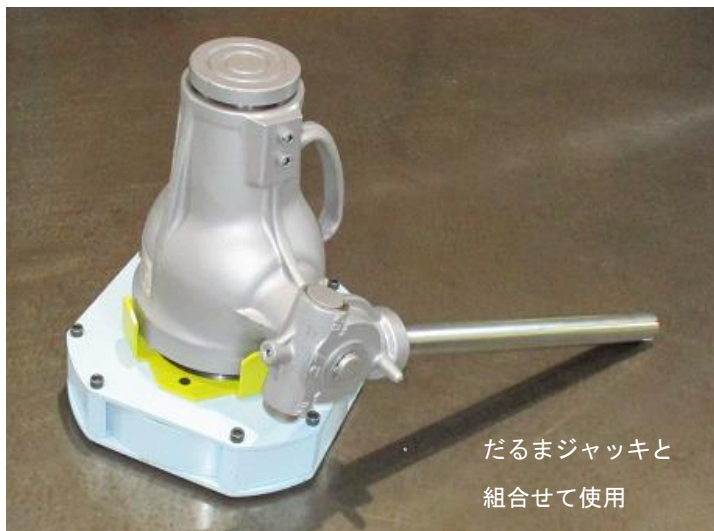
だるまジャッキと 組合せて使用